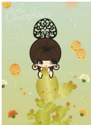
Arriba, ilustración de Marcos Chin. Sobre estas líneas, una obra de Terelo. A la derecha, Flower matango , de Murakami, que se pudo ver también en la exposición que le dedicó el Guggenheim de Bilbao.

Terelo recuerda su primera visita a Japón como «un choque cultural» a la par que como «una experiencia inolvidable». El primer contacto con el lejano archipiélago asiático no deja indiferente a nadie. «Para mí fue interesante comprobar en qué somos tan distintos y en qué nos parecemos. Me gusta mucho el respeto que se practica hacia las personas, la seguridad que se puede sentir, el contraste entre el